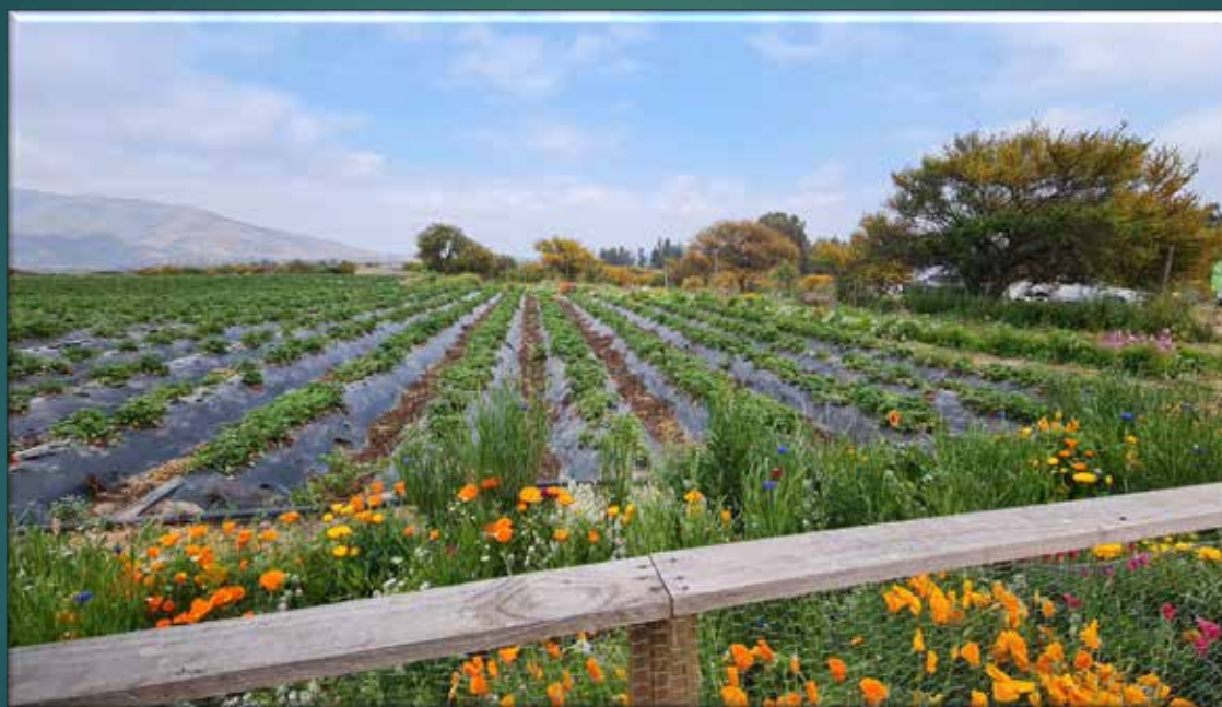
Producción de frutillas; Melipilla, 2022