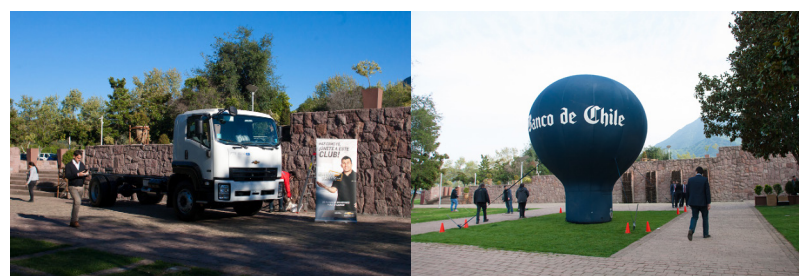
MAQUINARIA Y CORPÓREOS EXTERIORES