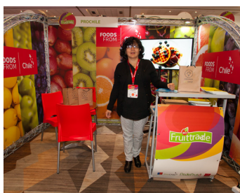
STAND 3 X 2

En caso de daño el costo de reparación por metro cuadrado de pasto con cargo al cliente será de UF 1,5 + IVA.